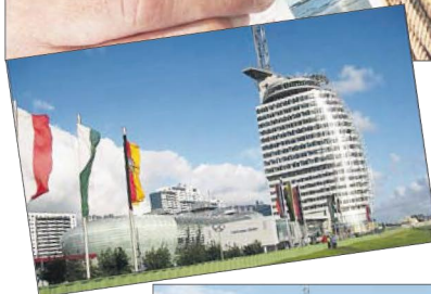
Die Skyline der Havenwelten mit Conference-Center, von Robert Borm.