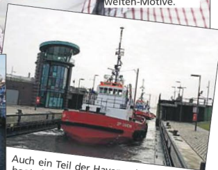
Auch ein Teil der Havenwelten: die Sportbootschleuse im Neuen Hafen beim Einlaufen der Schlepper.